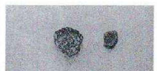
Ⅲ次調査出土埴塼 内面