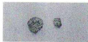
Ⅲ次調査出土埴塼 外面