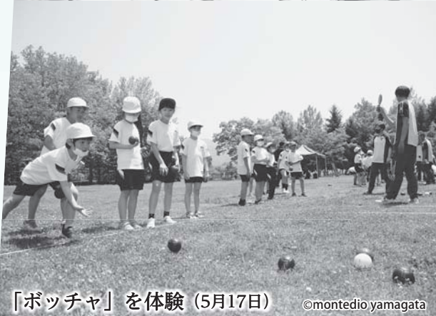
「ボッチャ」を体験 (5月17日)