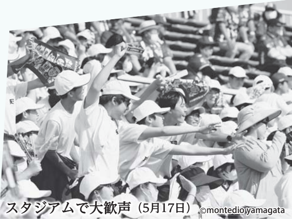
スタジアムで大歓声 (5月17日)