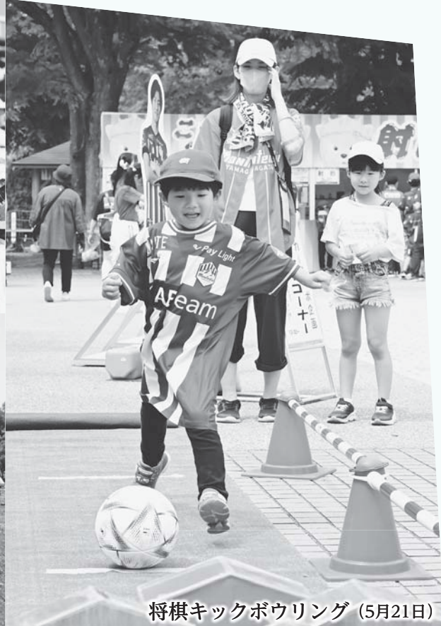
将棋キックボウリング (5月21日)