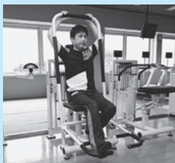
▲胸や肩の動的ストレッチマシン