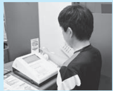
▲骨の強さを測定する骨健康度測定器