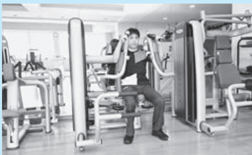
▲筋力強化のためのトレーニングマシン