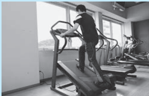
▲山登り用ウォーキングマシン