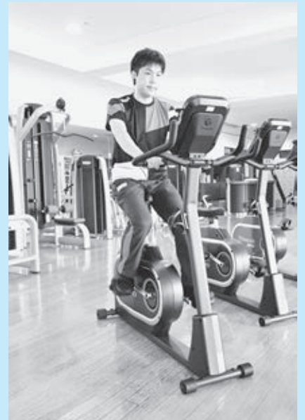
▲体力測定用バイクマシン