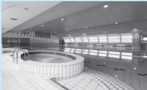
▲ボイラーを更新したプール