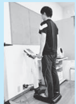
◀筋力量や体脂肪率を測る体組成計