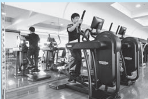
▲最新式の有酸素マシン