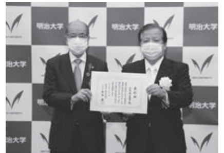
▲明治大学創立140周年功労者表彰を受賞(11月)