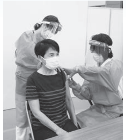
▲新型コロナウイルスワクチン集団接種のシミュレーションを実施(4月)