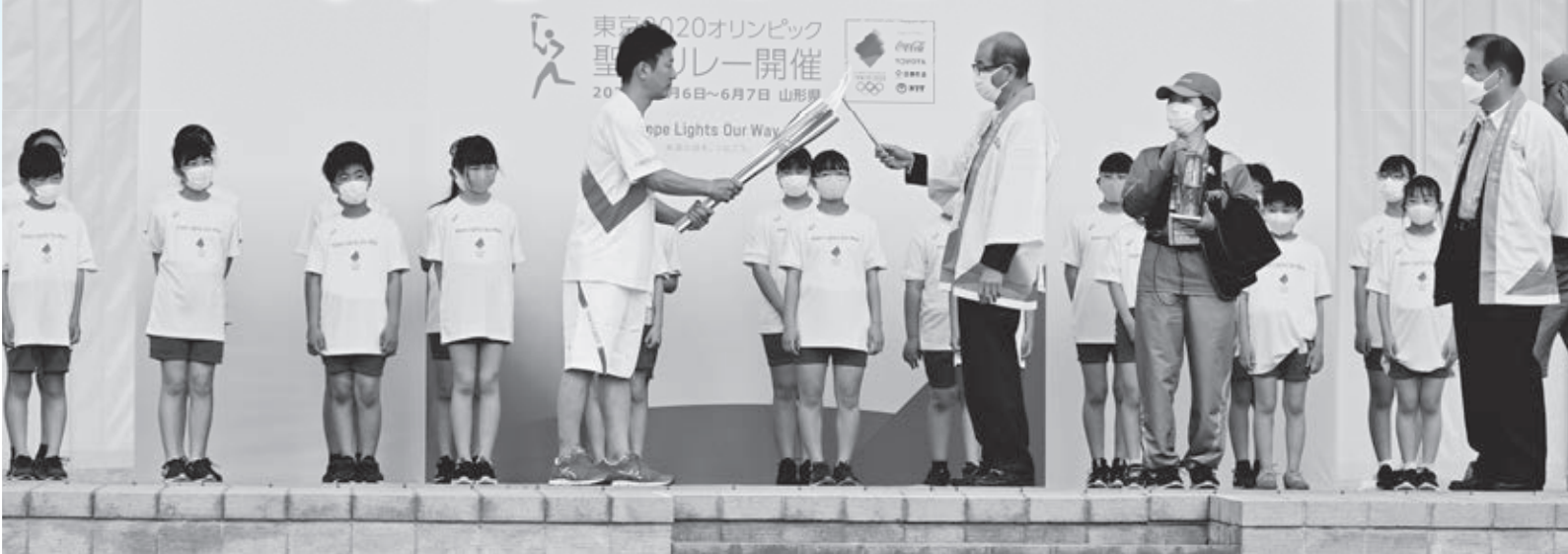
▲東京2020オリンピック聖火リレー出発式を開催（6月）