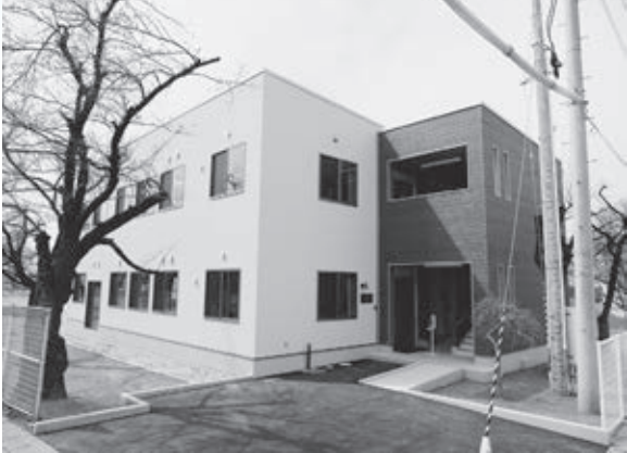
▲天童中央第二・第五学童保育所が落成(3月)