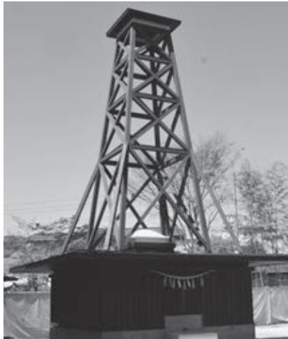
▲天童温泉第10号源泉・温泉櫓が竣工(4月)