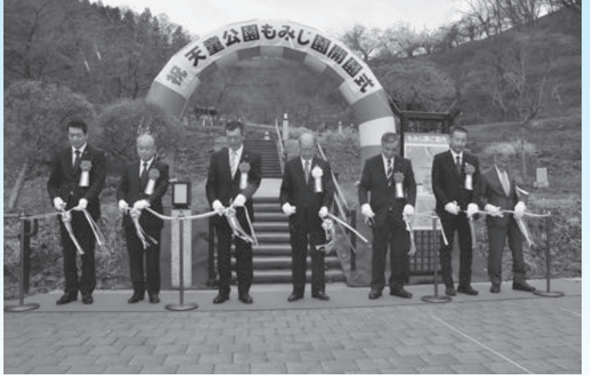
▲天童公園もみじ園が開園(4月)