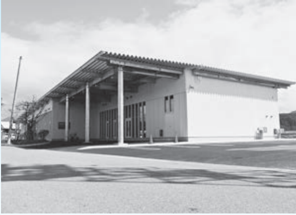
▲山口地域交流・活性化センター(市立山口公民館)が落成(3月)