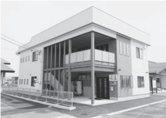
▲高橋第三・第四児童クラブが落成(3月)