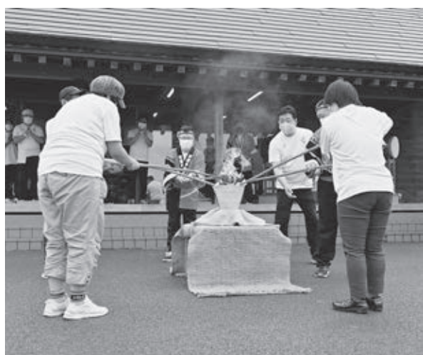
▲東京2020パラリンピック聖火フェスティバルに向けた採火式を開催（8月）

ことしは、昨年に引き続き、新型コロナウイルス感染症に注意しながら行動する1年となり、人間将棋や天童夏まつり、天童ラ・フランスマラソンが2年連続で中止することとなりました。