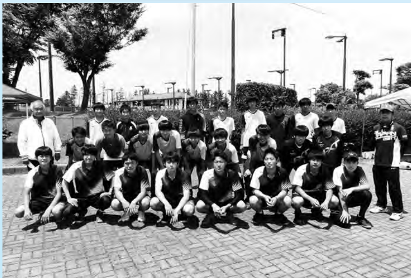
▲県高校総体集合写真（写真はすべて令和3年度）

創学館高校は、平成30年4月に山形電波工業高校から校名を変更しました。本校は、天童市清池にある実業高校です。バラエティーに富んだ数多くの部活動があります。今回は、ソフトテニス部の活躍を紹介します。