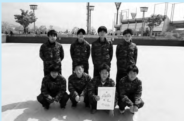
▲村山地区高校総体団体戦第3位

創学館高校は、平成30年4月に山形電波工業高校から校名を変更しました。本校は、天童市清池にある実業高校です。バラエティーに富んだ数多くの部活動があります。今回は、ソフトテニス部の活躍を紹介します。