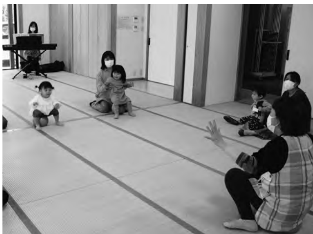
▲ボールを使って親子で一緒に楽しく遊びました