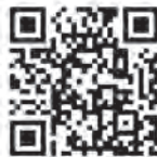
▲移住ポータルサイト

移住者を増やすには「関係人口」を増やそうということで、日々あれこれ考えておりますが、さて、その関係人口とはどんな人のことでしょうか？まず思いつくのは、ふるさと納税の寄付者です。彼らは寄付をしていただけるほど市への関心が高いわけですから、例えば寄付者限定の観光ツアーを企画すれば、けっこうな人数が足を運んでくれるものと思います。実際に天童の魅力を感じていただくことで、観光のリピーターとなり、やがては移住を検討していただけるかもしれません。ふるさと納税の寄付者との関係は市の貴重な財産です。こうした方々との関係を深め、市のさまざまな施策に活かさないかこれからも考えていきたいと思っております。