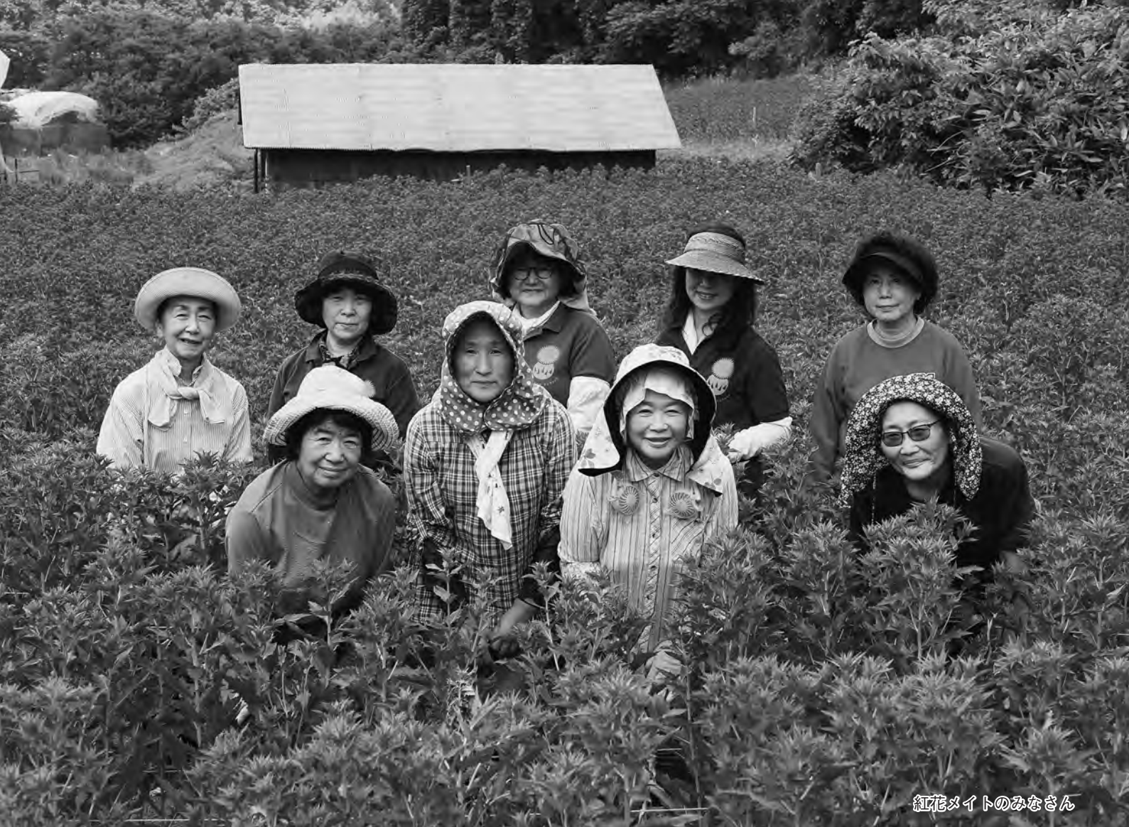
紅花マイトのみなさん