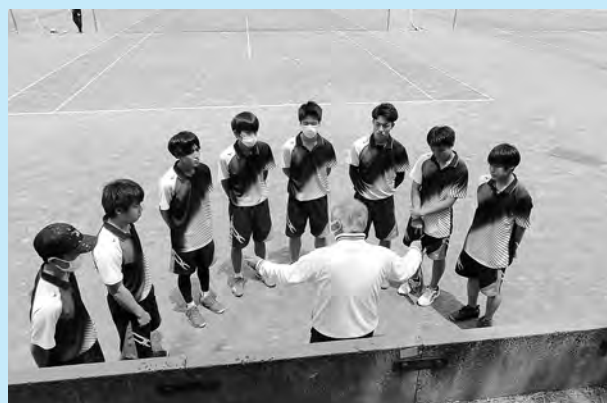
▲県高校総体団体戦前の様子

失われてしまいました。部活動ができない状況で、不安やストレスを感じることもありました。 しかし、そんな状況でも、自分たちに何ができるかを考え、知恵を絞り、困難を乗り越えてきました。お互いを思いやり、自分のできる精一杯で周囲に貢献することが、未来を切り開く力になるということを私たちは学びました。 ことしは2年ぶりの県高校総体を実施されました。団体戦優勝には届きませんでしたが、優勝を狙える力も付いてきました。各種大会では、チーム一丸となって試合に臨み、優勝を目指します。 今後の活躍にご期待ください。