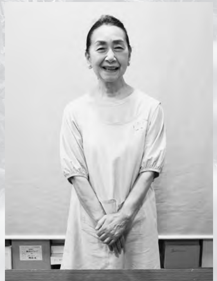
おくのほそ道天童紅花まつり実行委員 紅花染め指導者

紅花を栽培していただくボランティア「紅花メイト」の活動も7年目を迎え、ことしは100人以上の方が紅花メイトとして活動しています。また、最近では津山・長岡・山口・千布の4つの小学校で、総合学習として紅花を育てていただいております。「紅花を自分たちが伝えていく」という子どもたちの姿に元気をもらっています。紅