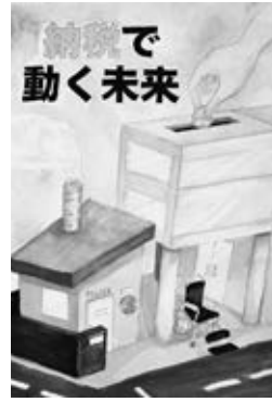
天童市長賞 伊藤虹心 (四中1年)