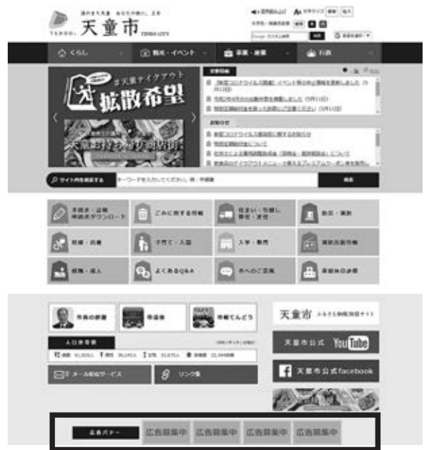
▲バナー広告掲載箇所