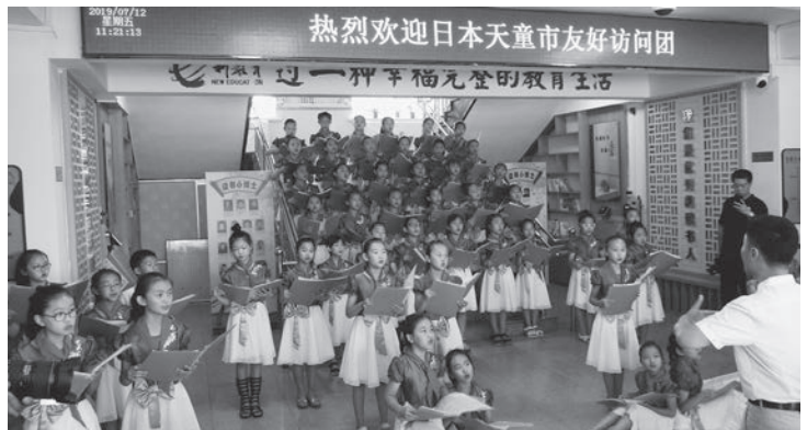
▲歓迎の合唱が披露されました