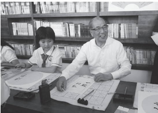
▲文化小学校での習字体験