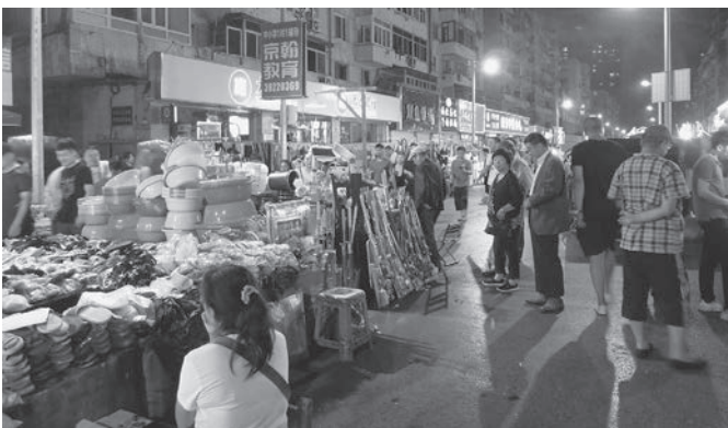
▲エネルギーに成長する姿を肌で感じました