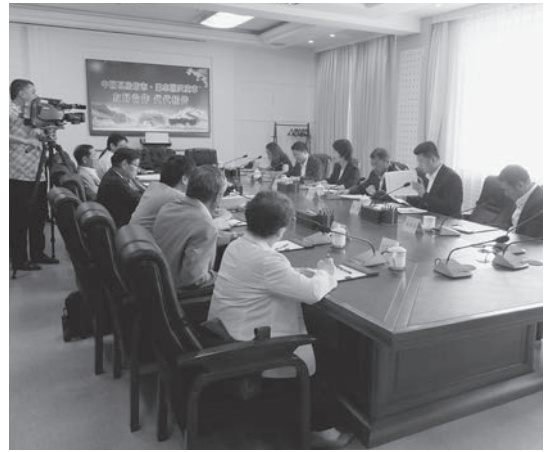
▲瓦房店市関係者（写真右側）との懇談