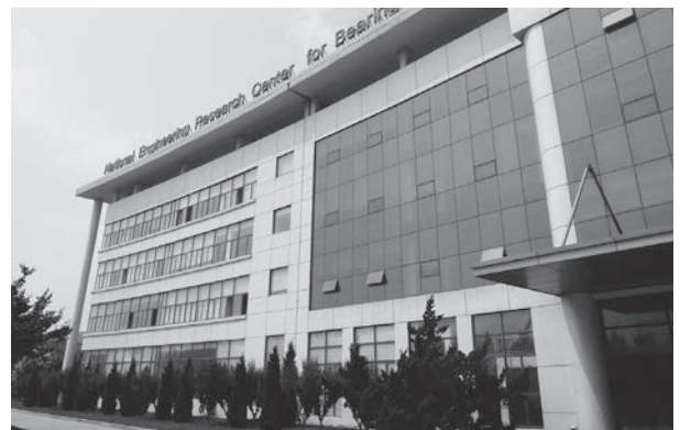
▲瓦房店市の重要産業ベアリング工場