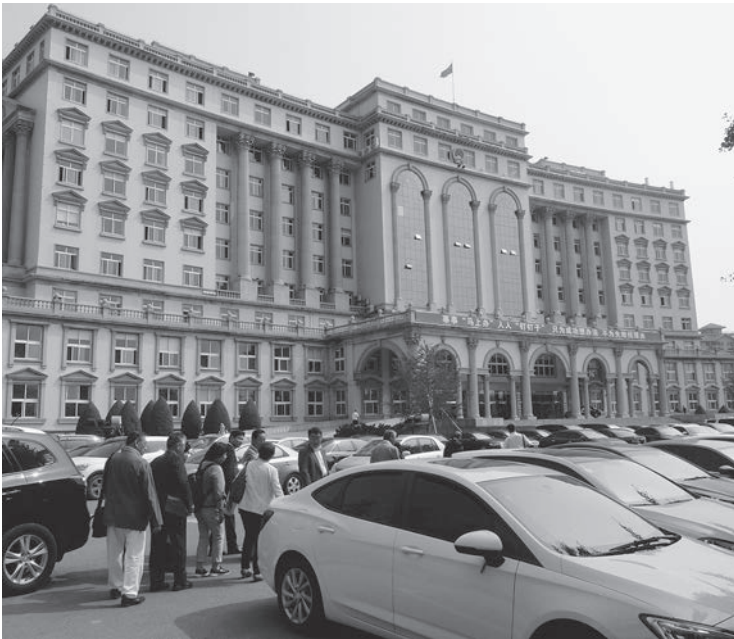
▲瓦房店市庁舎へ向かう訪問団一行