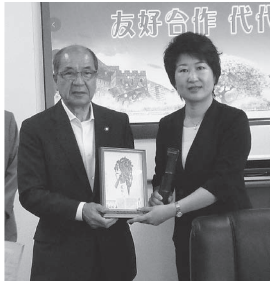
▲さらなる友好の推進が約束されました