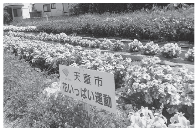
▲立宿花いっぱいボランティア