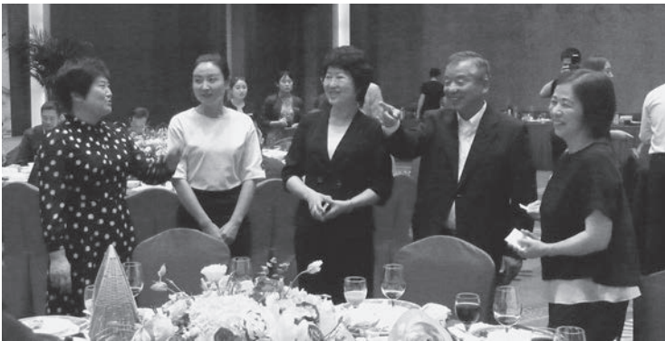
▲現地でのあたたかい歓迎