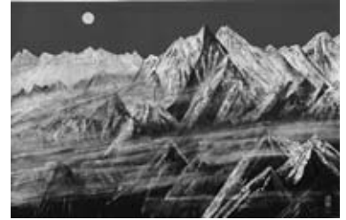
▲福王寺法林「ヒマラヤの月」