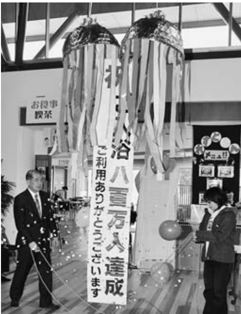
▲ゆびあの入浴者が800万人に

東日本大震災から間もなく2年が経とうとしています。本市では、安全で安心して暮らせるまちづくりに引き続き取り組んできたほか、第3子以降の保育料無料化を実施するなど、子育て環境の整備に力を注いできました。また、市立小・中学校の耐震化を完了し、市立第一中学校の改築を進めるなど、教育環境の整備に取り組みました。経済・農業の分野では、天童温泉しだれ桜まつりや天童産農作物の海外プロモーションを初めて行うなど、市民や団体と手をとり合って活発な活動を展開してきました。ことしも、さらなる発展を目指して幸せを実感できるまちづくりに取り組んでいきます。