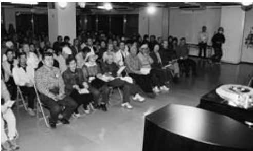
▲懐しの名曲を高音質で