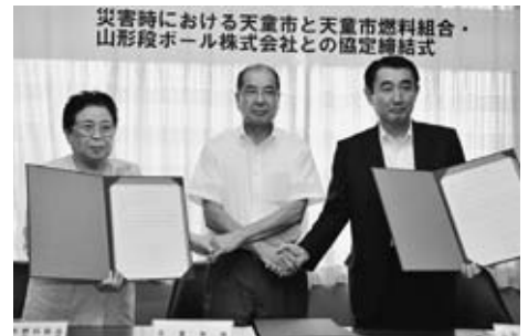
▲万が一に備えてさまざまな分野で災害協定を締結