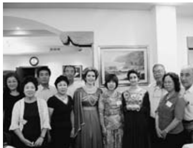
▲マロスティカ市で温かい歓迎を受ける訪問団