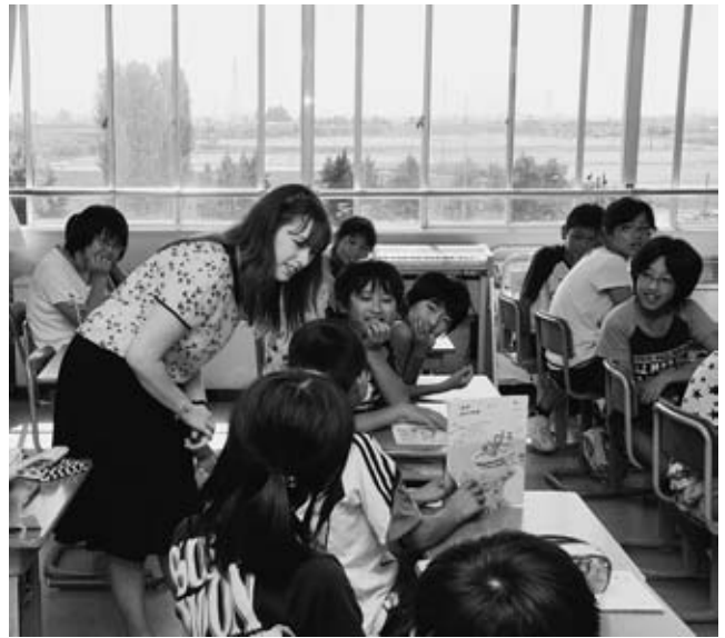
▲ALTを2人増員し、小・中学校の英語の授業を支援