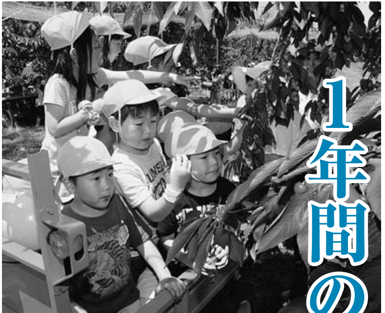
▲多賀城市の園児をサクランボもぎ取り体験会に招待