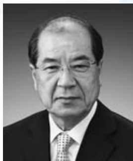
天童市長 山本 信治