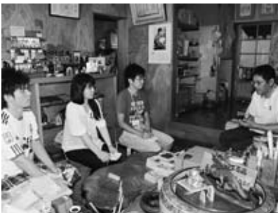
▲明治大学の学生が市内を巡り市の現状を視察