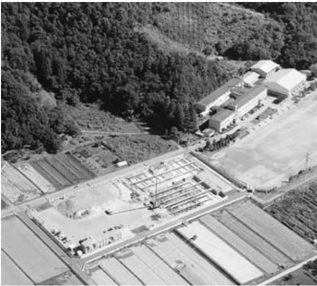
▲市立第一中学校改築工事を開始