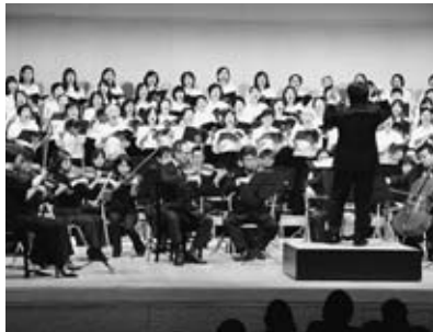
▲市民と山形交響楽団によるハーモニー