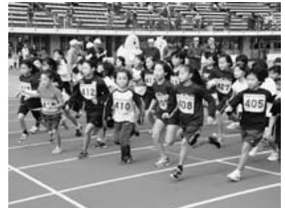
▲秋晴れの中、第1回ラ・フランスマラソン大会がスタート