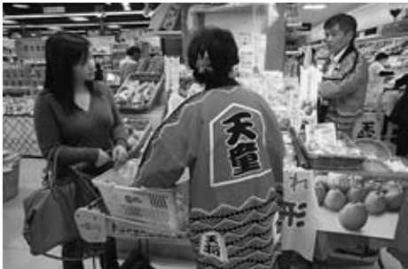
▲台湾でラ・フランスとシャインマスカットをピーアール