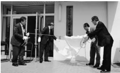
▲市上下水道事業所を開所

東日本大震災から間もなく2年が経とうとしています。本市では、安全で安心して暮らせるまちづくりに引き続き取り組んできたほか、第3子以降の保育料無料化を実施するなど、子育て環境の整備に力を注いできました。また、市立小・中学校の耐震化を完了し、市立第一中学校の改築を進めるなど、教育環境の整備に取り組みました。経済・農業の分野では、天童温泉しだれ桜まつりや天童産農作物の海外プロモーションを初めて行うなど、市民や団体と手をとり合って活発な活動を展開してきました。ことしも、さらなる発展を目指して幸せを実感できるまちづくりに取り組んでいきます。