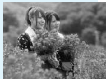
▲最優秀賞「花に埋もれて」