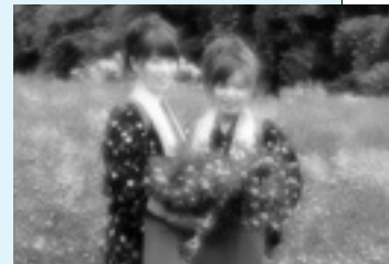
▲最優秀賞「2人の紅花娘」