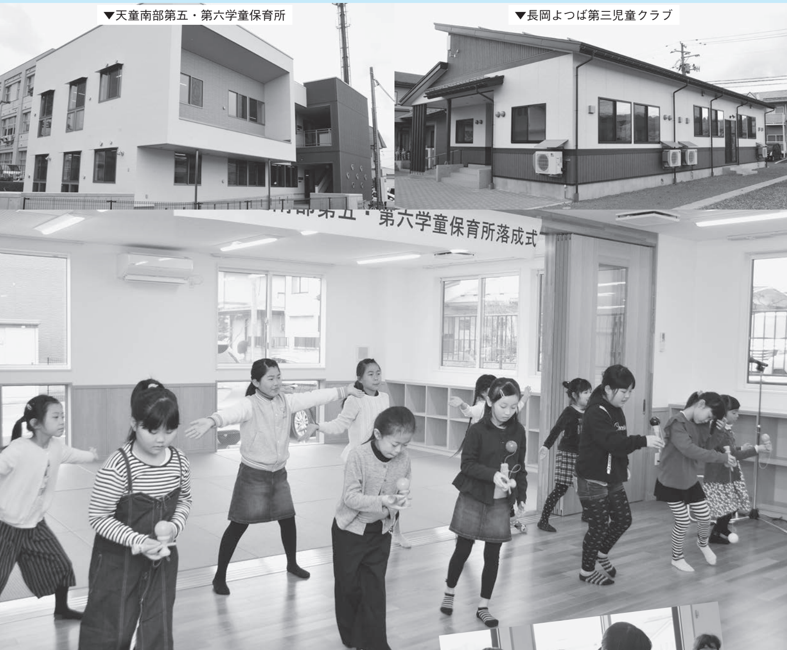
▼長岡よつば第三児童クラブ