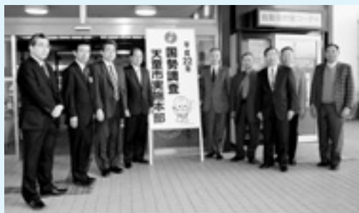
4月26日に市実施本部を設置し、27日に看板を取り付けました。