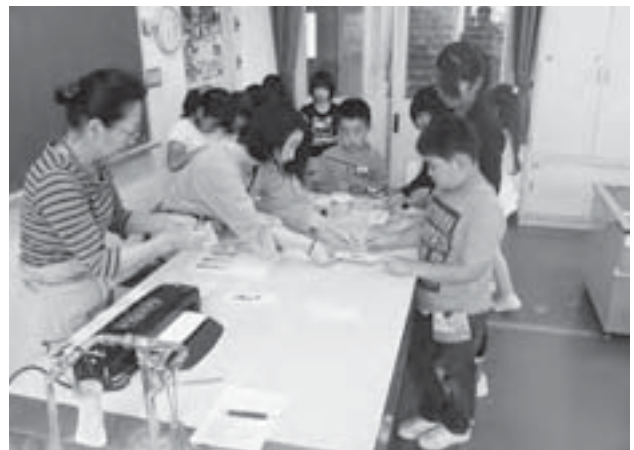
▲放課後子ども教室で児童の健全育成を図ります

資質向上を図るため、年1回の全員視察研修と年3回の全体会議を行い、委員の問題や悩みに対し、具体的な対策や対応を検討しています。また、地区ごとに月1回の定例会を開催し、さまざまな課題を検討しながら、支援を必要とする方が適切なサービスを受けられるよう、つなぎ役として地域福祉の推進を目指して活動しています。そして、いきいきサロンへの協力や学童保育所との共同での事業など、3つの地域ごとに特色のある福祉活動を展開し、みなさんがより良い生活を送ることができるよう支援を行っています。