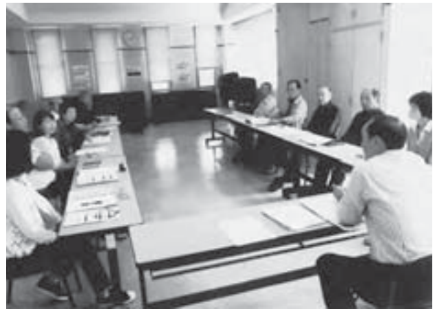
▲定例会で福祉課題を検討

また、地域の幅広い関係団体との連携を図りながら活動を進め、地域住民のみなさんと支え合う社会づくりを目指しています。そして、研修の充実により委員の資質を高めるとともに、定例会では地域の福祉課題の解決に取り組んでいます。