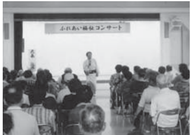
▲ふれあいコンサートはみなさんのお楽しみ会場

荒谷地域では、福祉推進委員、食生活改善推進委員会荒谷支部、駐在所の方などと協力して高齢者教室を開催し、参加者に楽しんでもらいながら健康づくりや学習活動を行っています。