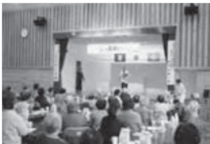
▲高掬サロン「こっ茶来い」