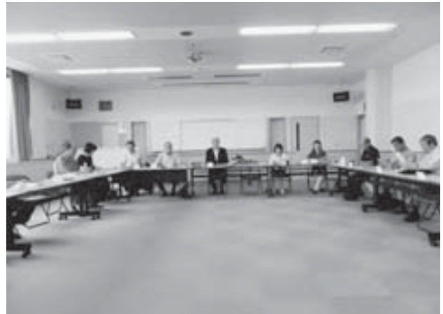
▲定例会では多くの意見が交わされます

地域の活動で困っていることなど、委員同士で気兼ねなく発言し、意見交換を行う風通しの良い協議会となっています。