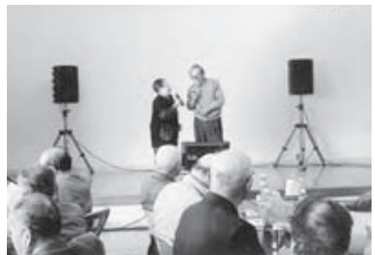
▲干布いきいきサロン活動