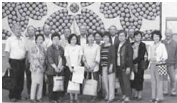
▲研修の充実により資質向上に努めています

地域住民のみなさんの身近な良き相談相手として、地域に根差した活動を行うことを第一に考えて活動しています。