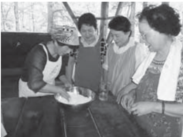
粉から生地を作る本格的なピザ作り