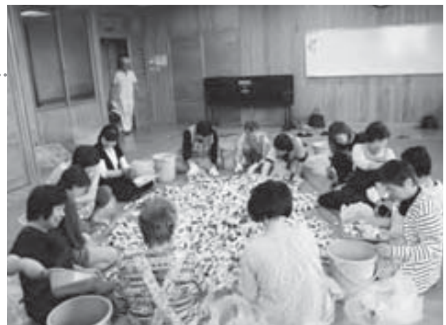
回収したキャップは資源として再利用されます

天童北部地域づくり委員会では、地域内の住民、学校、事業所、スーパーなどと協力して、エコキャップの回収運動に取り組んでいます。ごみとして捨てられるペットボトルのキャップを回収し、リサイクルに回すことで、資源の有効活用とともに、途上国の子どもへのワクチンの寄付となる取り組みを実践しています。平成19年から始めたこの取り組みにより、これまでに集まったエコキャップの累計は約293万個になります。今後もエコキャップの回収運動を継続し、ごみの減量と環境に配慮した地域を目指します。