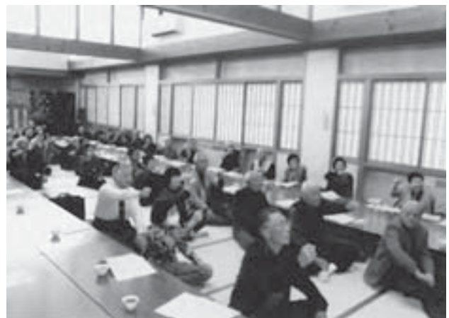
▲多くの参加者で盛況の福祉の集い

また、年1回の外部講師による研修会や福祉施設への視察などを行うことで、資質向上にも努めています。地域福祉推進委員や、食生活改善推進委員の方々と協力して研修会を実施するなどして、共に地域の高齢者を見守っています。