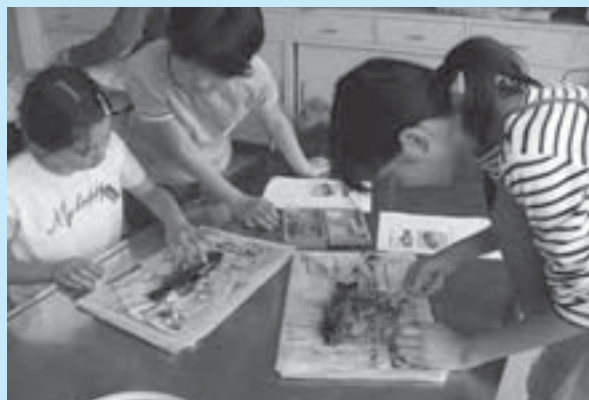
▲理科の授業では、マスの解剖学習で命の大切さを実感

六年一組では、理科の学習でマスの解剖を体験しました。児童は「キヤーキヤー」言いながら解剖はさみを使って恐る恐る切っていました。普段は見ることのできない内臓の仕組みを実際に目にし、しっかりと命の大切さを実感しました。 長岡小では地域のヒト・モノ・コトを積極的に授業に取り入れ、本物を見て、本物に触れることを大切に、学ぶ楽しさがあふれる授業を展開しています。