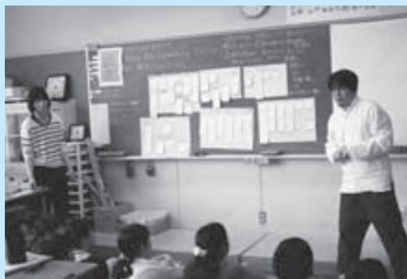
▲地元のプロデザイナーの方によるアドバイス

さらに、みなさんからより愛されるゆるキャラとなるよう、地元のプロデザイナーの方からアドバイスをいただきました。