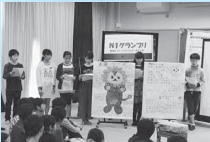
▲長岡をPRするゆるキャラ長岡ライ元のプレゼンテーション

長岡小では、主に総合的な学習と生活科の授業時間内に、豊かな体験活動を積極的に取り入れて、学ぶことが楽しい学校を目指しています。今回は、ゆるキャラ作りと理科の解剖学習の取り組みについて紹介します。