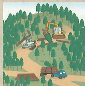
適切に森林整備を推進!

ことから、森林の土地の所有者の把握を進めるため、平成24年4月から森林法に基づく森林の土地の所有者となった旨の届出制度が創設されました。なお、この届出により、森林の土地の所有権の帰属が確定されるものではありません。